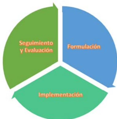
Figura 1. Ciclo para formular una política pública

Para implementar una política pública sectorial se debe respetar el ciclo de la misma, de acuerdo a la Guía para la formulación de políticas públicas sectoriales, elaborada por la Secretaria Nacional de Planificación y Desarrollo (Senplades) en Ecuador, el ciclo de una política pública sectorial es el que se detalla en la figura x a continuación