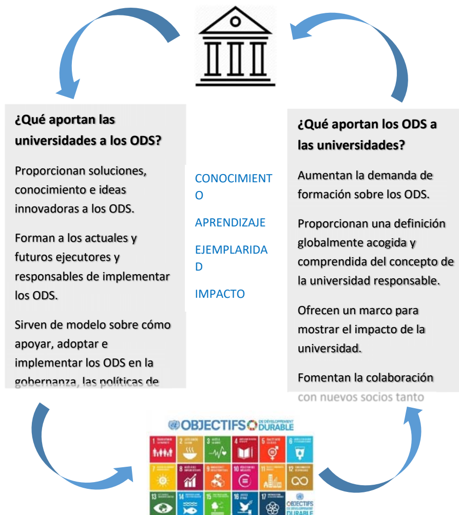
Figura 1. Razones de la universidad para contribuir con los ODS

Las universidades ocupan un lugar privilegiado dentro de la sociedad. Con un incuestionable protagonismo en torno a la creación y difusión del conocimiento, las universidades han sido durante mucho tiempo potentes impulsores de la innovación global, nacional y local, el desarrollo económico, y el bienestar social. Como tal, las universidades tienen un papel fundamental para lograr el cumplimiento de los ODS, a la vez que pueden beneficiarse enormemente al comprometerse con esta Agenda (ver Figura 1).